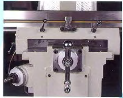
● Y軸-方型滑道(特別配備)